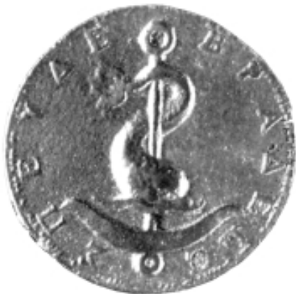
Marca tipografica di Aldo Manuzio. Vicenza, Museo Civico.

In un'azienda di medie dimensioni, l'editore è colui che si trova a dover governare un traffico fatto di persone e documenti. Lo scenario è stato schematizzato in maniera fedele nel libro uscito, Voltare pagina , di Paola Dubini (seconda edizione, Etas Libri, Milano, 2002).